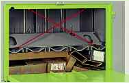
Robust: Der beidseitig geführte Pressstempel