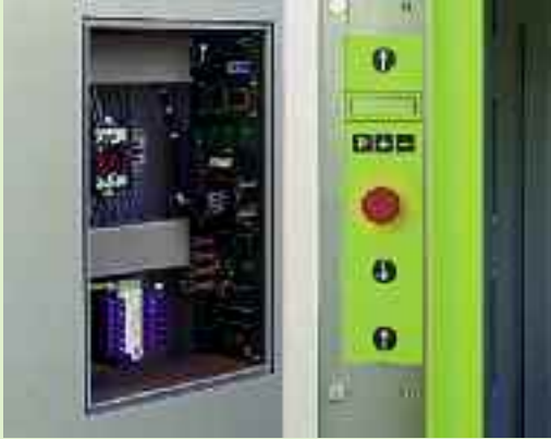
Wartungsarm: Die Microprozessorsteuerung