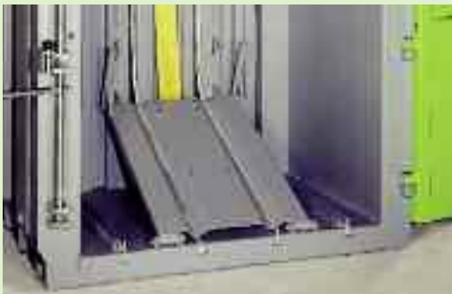
Leicht zu bedienen: Der Auswerfer