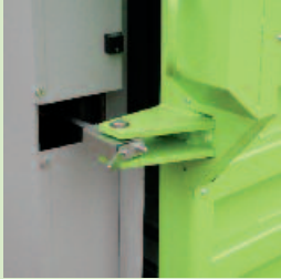
Der hydraulische Türöffner