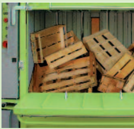
Selbst Holzkisten und Ähnliches sind für die DIXI 60 S kein Problem