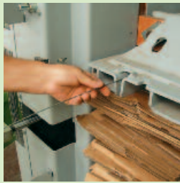
Einfachste Abbindung mit Draht**