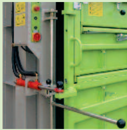
Der hydraulische Türöffner (Option)