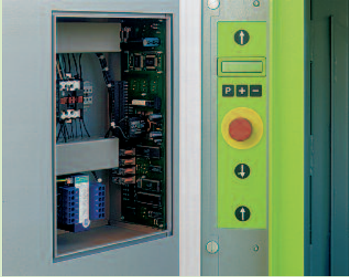
Wartungsarm: Die Microprozessorsteuerung