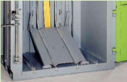
Leicht zu bedienen: Der Auswerfer