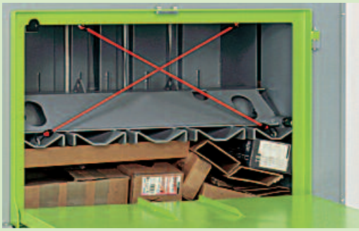
Robust: Der beidseitig geführte Pressstempel